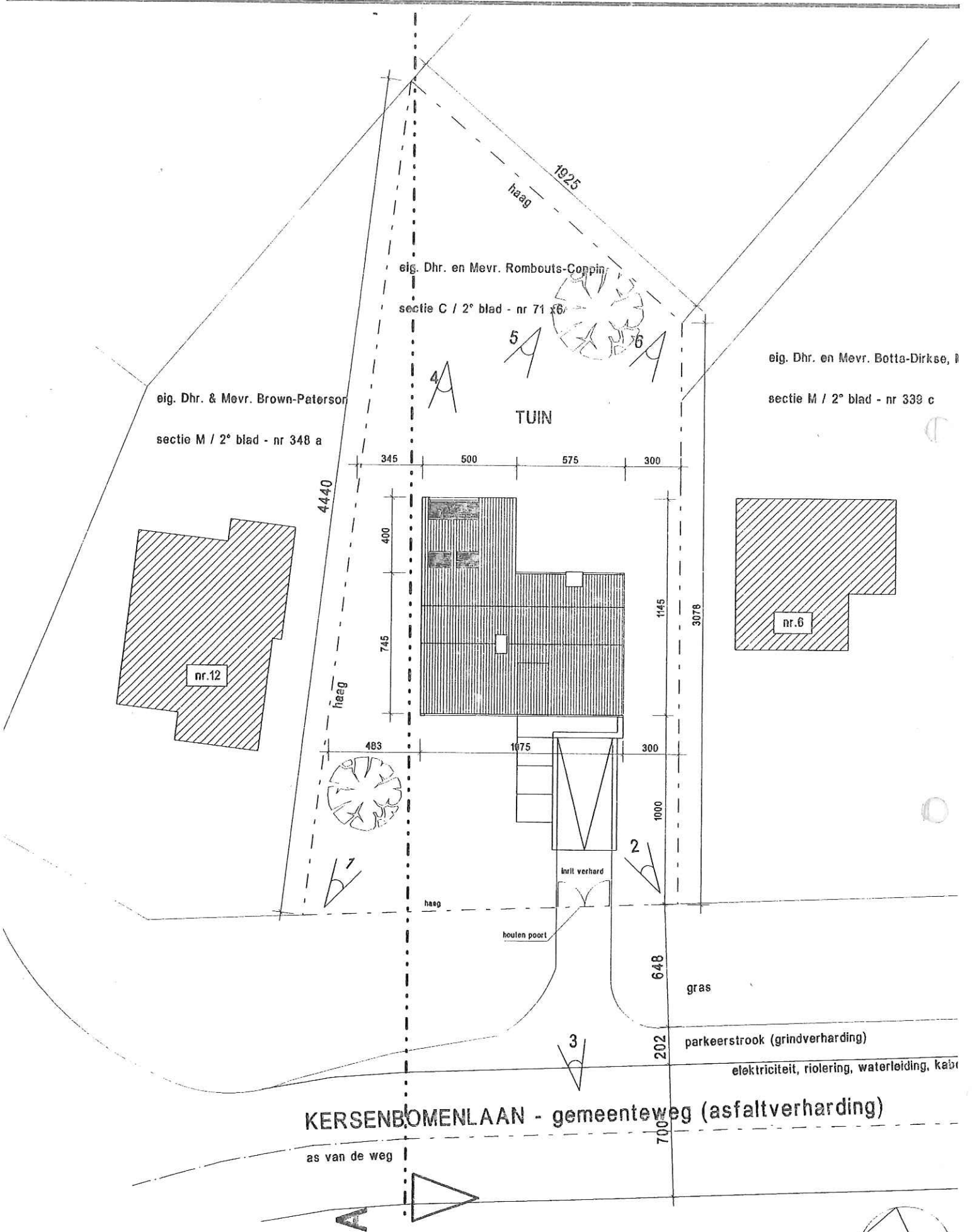
INPLANTINGSPLAN schaal 1/250